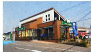
モスバーガー 北へ 徒歩2分