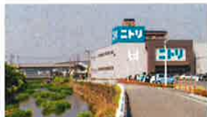
ニトリ 南となりに隣接