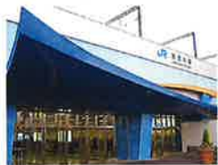
JR加古川駅 東へ 徒歩12分