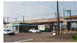
ファミリーマート 西へ 徒歩2分